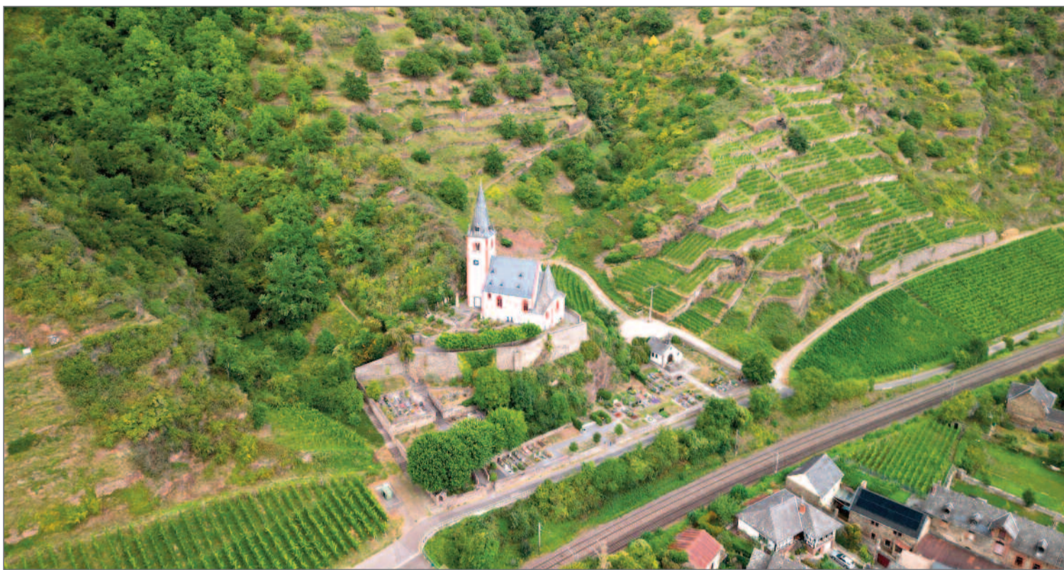
Johanniskirche inmitten der Hatzenporter Weinberge im September 2025.

MENSCHEN IM DORF • KOLUMNE • HEIMAT • DORFGESCHICHTE(N) • AUS DER REGION • SPITZE IM SPORT