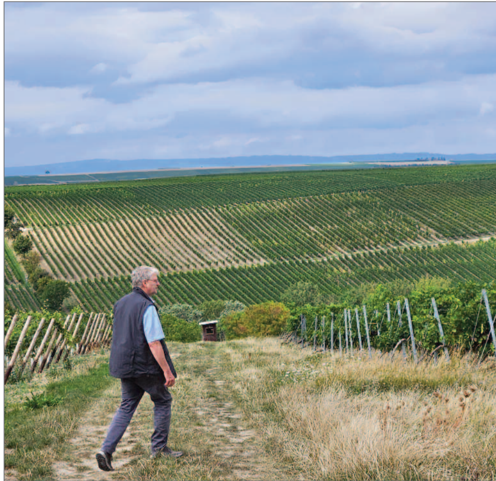
Der wanderfreudige Gatte in der rheinhessischen „Hiwwellandschaft“.

Aber - deren Weinfeldern liegen nicht nur in der Ebene, sondern, wenn auch sehr flach, auf Hochplateaus und an Hängen. So muss ich doch langsam, aber stetig nach oben. Ich keuche, schwitze und schimpfe, weil mein Mann offenbar leichten Fußes immer ein paar Meter vor mir wandert. Und sich ein paar Mal umdreht: „Schaffst du das oder soll ich das Auto holen?“ Das wäre ja gelacht, diese kleine Hiwweltour werde ich wohl schaffen. Im Grunde weiß ich, es liegt nicht an den Hiwweln, sondern an der mangelnden Fitness, die es dringend zu verbessern gilt. Die wenigen Tage bei den rheinhessischen Winzerkollegen sind dafür