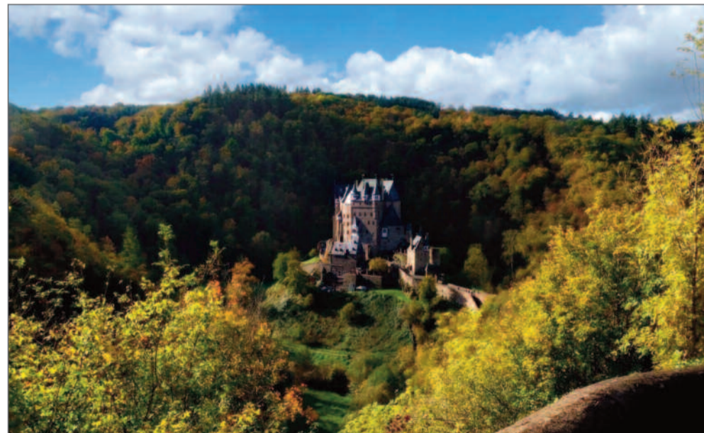
Burg Eltz im Herbstlicht.

Als ich zurückfahre, suche ich nach den Wildschafen. Sie sind längst im Wald verschwunden. Ich bleibe staunend zurück und denke, dass es besonders ist, was uns die Natur rund um Hatzenport alles so bietet.