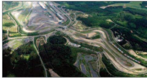
Luftaufnahme vom Nürburgring 2004.

Die Rennstrecken mussten kürzer werden, im Idealzustand sollte man die Fahrer während der kompletten Runde sehen.