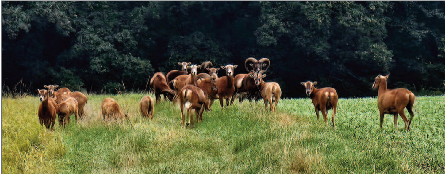
Die Mufflonherde auf der Bergwegswiese.

MENSCHEN IM DORF • DREI FRAGEN AN • HEIMAT • DORFGESCHICHTE(N) • AUS DER REGION • MEINE WOCHE