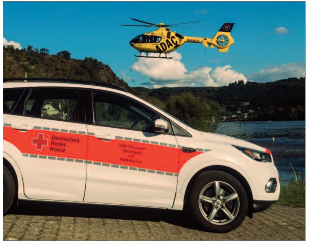
Einsatz in Hatzenport.