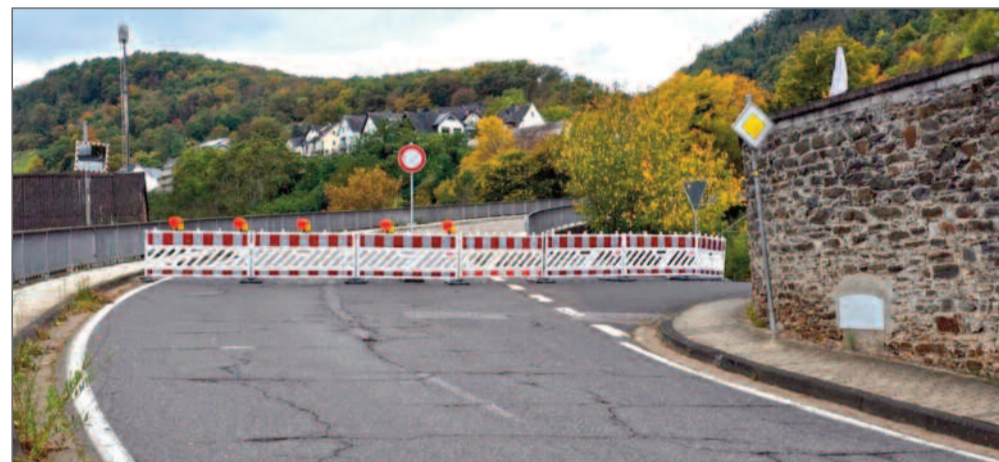
Sperrung am 15.10.25 eingerichtet.

Leben im Dorf ist Vereins-sache. Das ist gut, dafür sind Vereine da. Was wären wir ohne den Heimatverein, die Dorfgemeinschaft und alle anderen? Geselligkeit, Frohsinn und Miteinander kann man nicht von oben verordnen, es muss von unten wachsen.