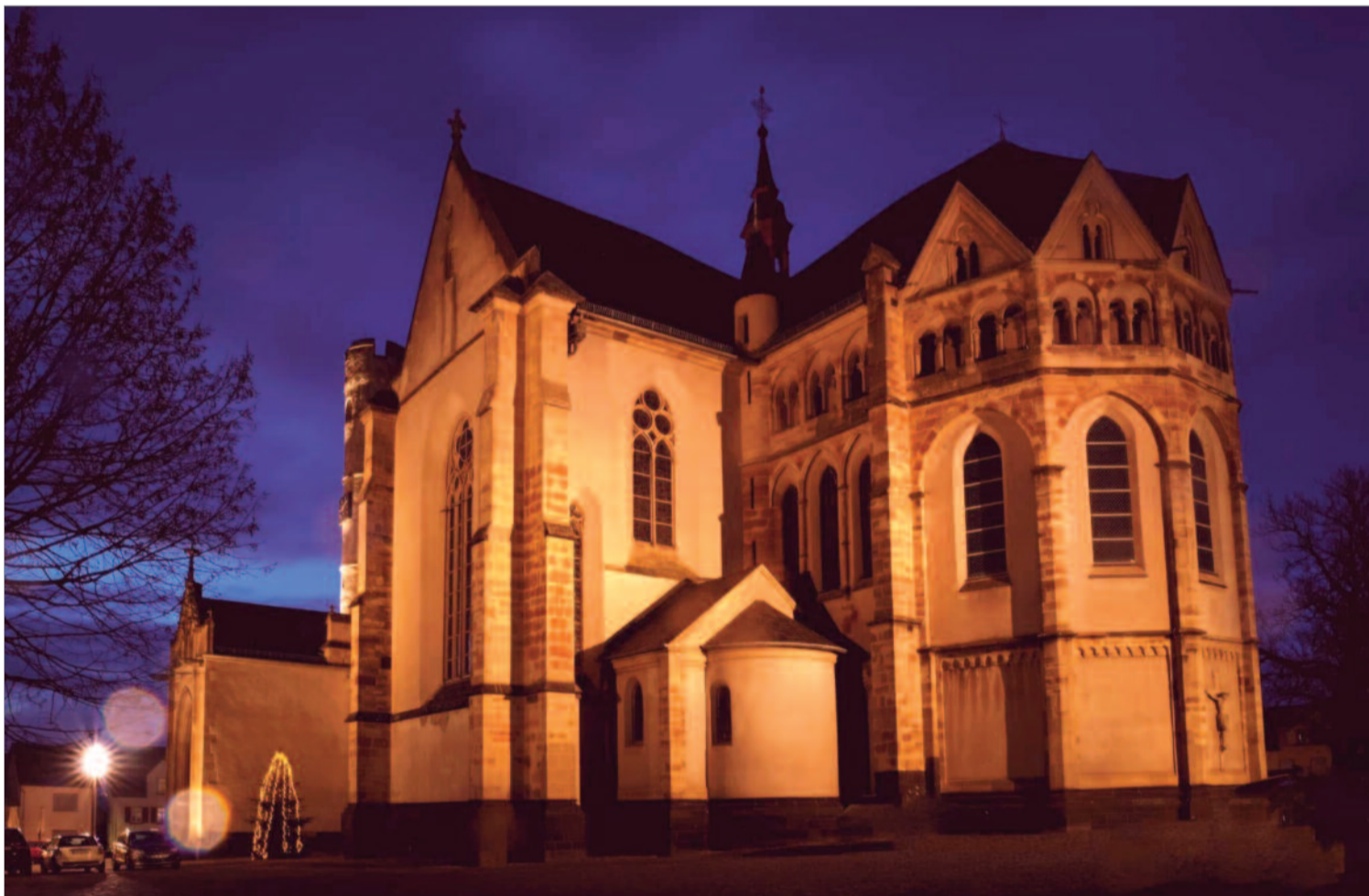
Die Stiftskirche in Münstermaifeld im Advent.

MENSCHEN IM DORF • ZWEI FRAGEN AN • HEIMAT • SILBENRÄTSEL • AUS DER REGION • MEINE WOCHE