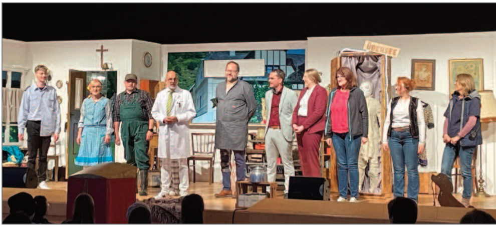
Der Applaus gehört den acht Darstellern und ihren Assistentinnen.