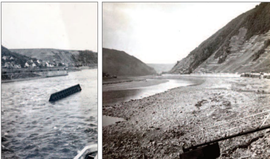
Bild links: Das Stauwehr ist unterhalb der Schleuse moselabwärts unterwegs. Das rechte Bild zeigt ein Moselrinnsal vor Brodenbach Richtung Alken. Bild unten: Der „Moselbach“ vor der Sternburg in Löff.

Ich bin froh, sie geschafft zu haben, die Oberstraße, Hatzenports Avenue. In vielen Jahren ist manches beim Alten geblieben, manches Haus wurde zur Ferienwohnung mit wechselnden Bewohnern. Schön ist es, wenn der eine oder andere Bewohner aus früheren Zeiten in der Erinnerung weiterlebt. Ich habe einiges und einige übersehen, es tut mir leid. Ich muss die Einwohner noch besser kennenlernen. Und ich gelobe Besserung. Sprecht mich doch beim nächsten Rundgang einfach darauf an. Mich und meinen Hund kennt Ihr ja. HPS