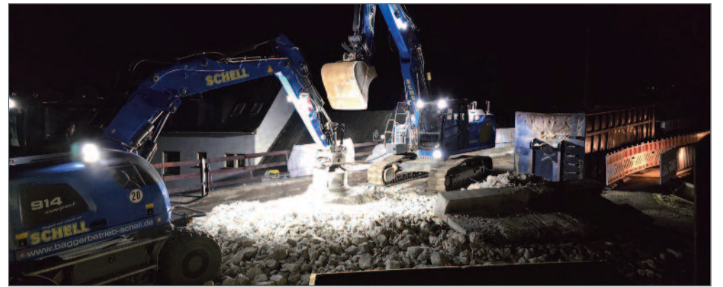
Bagger an der Überführung im November 2025.

Nach intensiver Untersuchung diagnostiziert Lars eine akute „Bagger- und Baumaschinen-Allergie“. Er wiegt den Kopf hin und her und meint dann, das sei eine konkrete Folge der derzeitigen Baumaßnahmen im Dorf, besonders der unmittelbaren Arbeiten vor meiner Haustür. Zu meiner großen Beruhigung hat unser Arzt aber auch gemeint, ich sei nur beschränkt eingeschränkt. Tabletten gibt es für diese