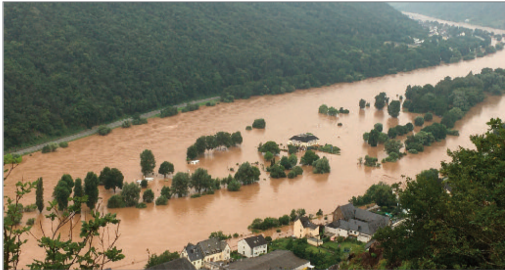
Hochwasser an der Mosel - in jenem Jahr besonders heftig.

2021 gab es wegen Corona nur ein virtuelles Weinfest. Das war mutig, machte viel Arbeit, aber gelang. Der Friedhof wurde neu gestaltet, das Kreuzlaykreuz repariert, der Kräutergarten dank vieler Ehrenamtlicher in Form gebracht. Und es gab dafür den Edeka-Preis für Nachhaltigkeit. Das Theater fiel aus; Proben konnten nirgends stattfinden. Die Bewegungsinitiative kam in Schwung. Die Gastronomie zeigte trotz Corona Momente der Belebung. Im Paulys gab es einen Handwerkermarkt, im Brunnenhof Backen wie zu Großmutterzeiten.