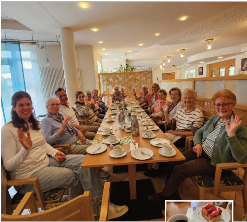
Dabei sein bewegt: Hatzenporter Bewegungsgruppe beim Glücks-Nachmittag.