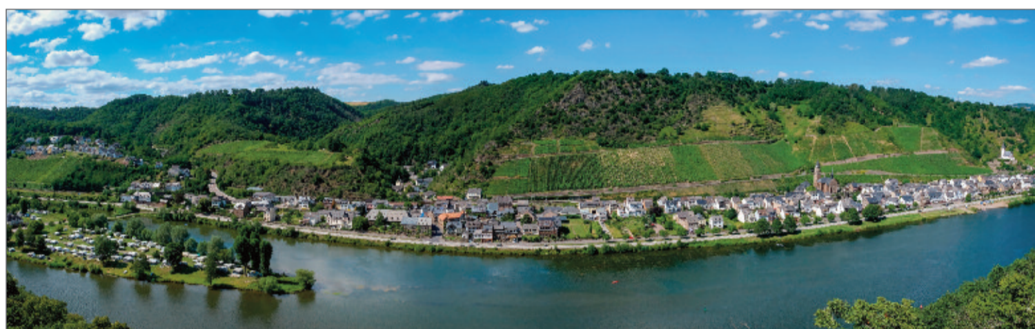
Blick von der Siebenuhrlay.

5 JAHRE DAS BLATT • MEINE WOCHE • AUS DER REGION • DIE REISE DURCHS DORF • WIR ERKLÄREN BEGRIFFE