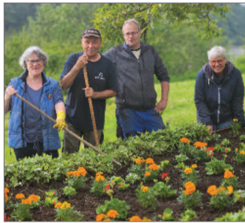
Ehrenamtler bei der Pflanzaktion