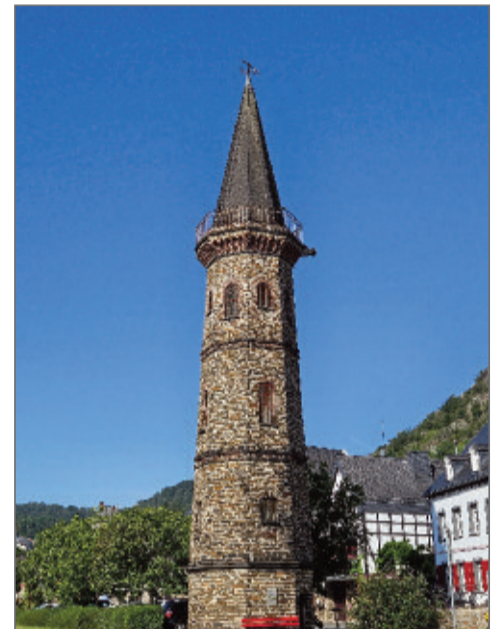
Der Fährturnm feiert Jubiläum.