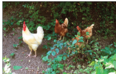
Hühner sind der letzte Schrei.