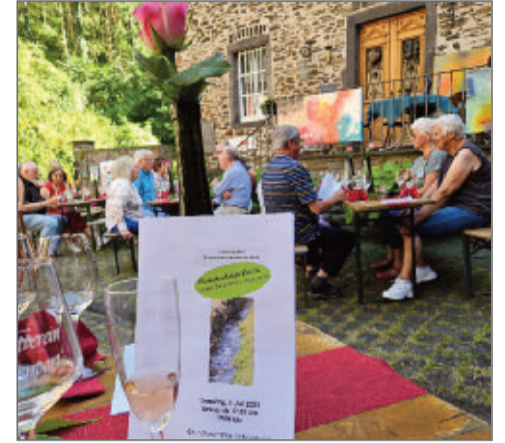
Mundart am Bach.