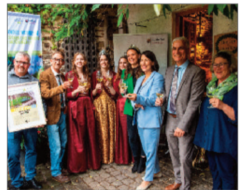
Leuchtpunkt der Artenvielfalt.