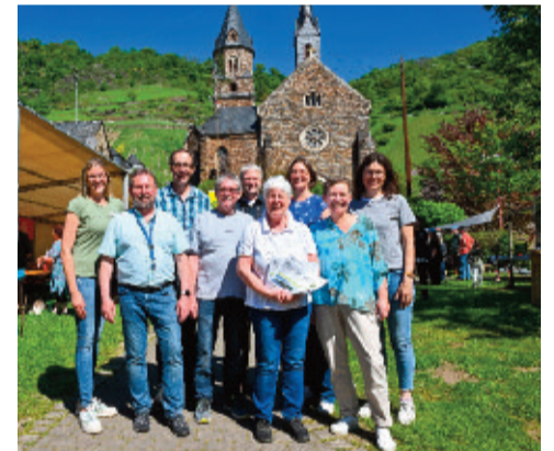
VG Wandertag mit Akteuren.