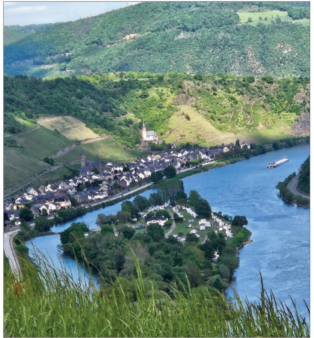
Der Blick 2025: Hatzenport - so wie es bleibt ...

Was geschah weiter in diesen fünf Jahren? Das erzählen wir Ihnen auf den Seiten 4 + 5 : Corona, die neuen Katzeköpp, das Jubiläum des Fährturms, den Glücksabend, die Mundart am Bach und immer wieder die Menschen, die eine lebendige Gemeinschaft gestalten, lassen wir Revue passieren.