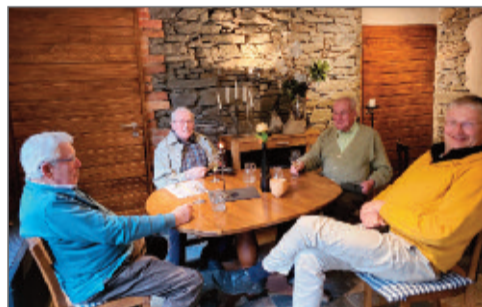
Der letzte traditionelle Frühschoppen

2021 gab es wegen Corona nur ein virtuelles Weinfest. Das war mutig, machte viel Arbeit, aber gelang. Der Friedhof wurde neu gestaltet, das Kreuzlaykreuz repariert, der Kräutergarten dank vieler Ehrenamtlicher in Form gebracht. Und es gab dafür den Edeka-Preis für Nachhaltigkeit. Das Theater fiel aus; Proben konnten nirgends stattfinden. Die Bewegungsinitiative kam in Schwung. Die Gastronomie zeigte trotz Corona Momente der Belebung. Im Paulys gab es einen Handwerkermarkt, im Brunnenhof Backen wie zu Großmutterzeiten.