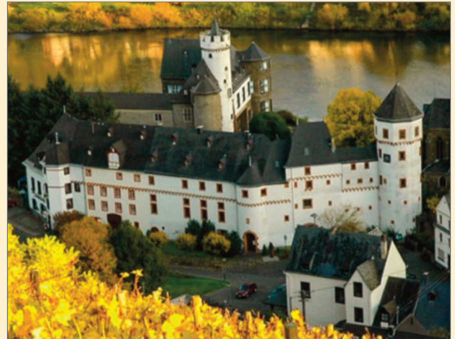
Heimatmuseum im Schloss von der Leyen.

Er, der mit 9 Jahren bei seiner Cousine in Hatzenport die Trompete entdeckte. Und der in der Folge durch seine Musik viele Menschen glücklich machte.