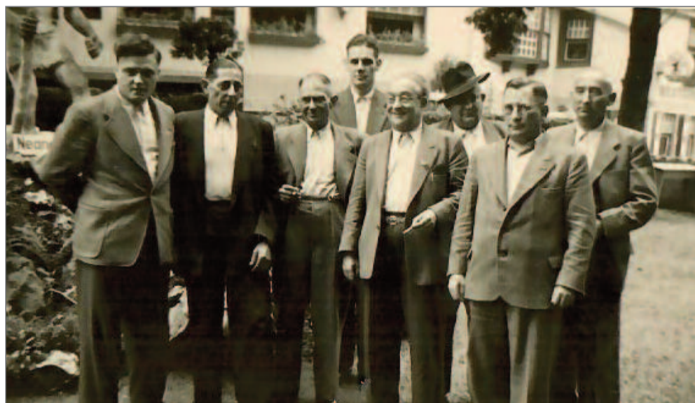
Gruppenfoto vor 70 Jahren.

Um 1950 entstand dieses Foto, dessen Urheber leider unbekannt ist. Es zeigt eine Männergruppe, deren Gesichter vielen noch bekannt sein dürften. Wer kann bei den Namen helfen? Gerne an die Redaktion: info.DasBlatt@web.de .