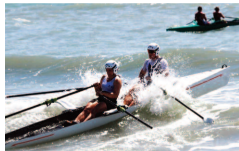
Slalomparcour um zwei Bojen. An einer dritten Boje erfolgt eine 180-Grad-Wende

Der Wettkampf beginnt am Strand und die Athleten laufen zum Boot, dann folgt ein